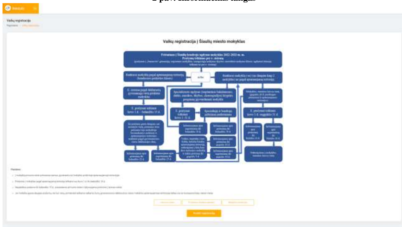
2 pav. Informacinis langas

3. Paspaudus laukelį „Registracija“, atsiveria informacinis langas (žr. 2 pav.), kuriame pateikiama bendra informacija apie mokinių priėmimą į mokyklą: priėmimo procedūros ir terminai, nuorodos į Priėmimo tvarkos aprašą, Mokyklų teritorijų aprašą ir laisvų vietų sąrašą. Susipažinus su informacija galima spausti mygtuką „Pradėti registraciją“.